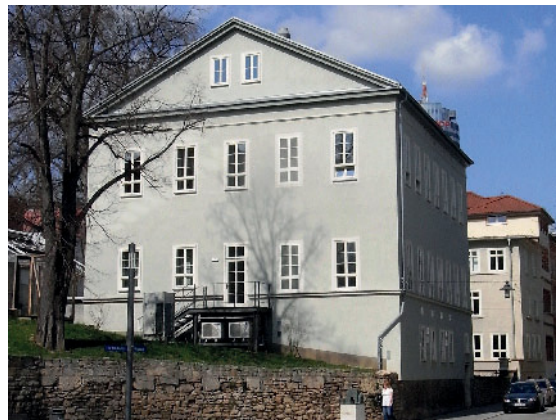
Das Haus im Jahr 2016.